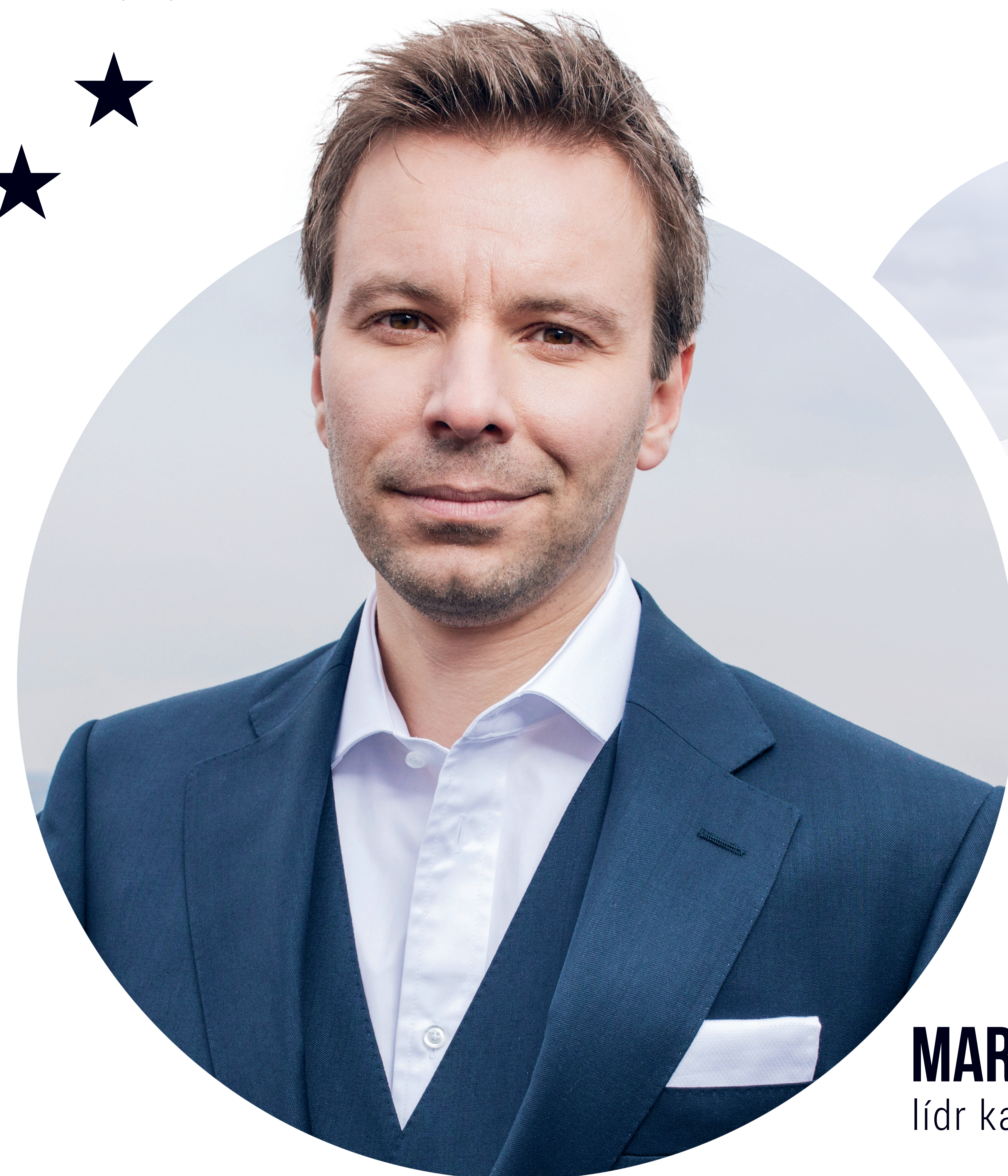
MARCEL KOLAJA lídr kandidátky do EP